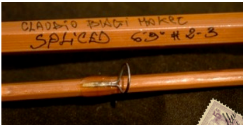
Anelli in Titanio legature Seta yli