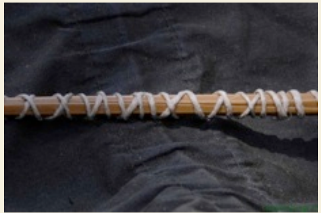
Legatura con filo in canapa